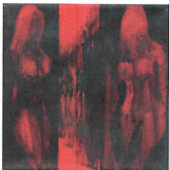
Fatbarda Sulaj - Albánsko